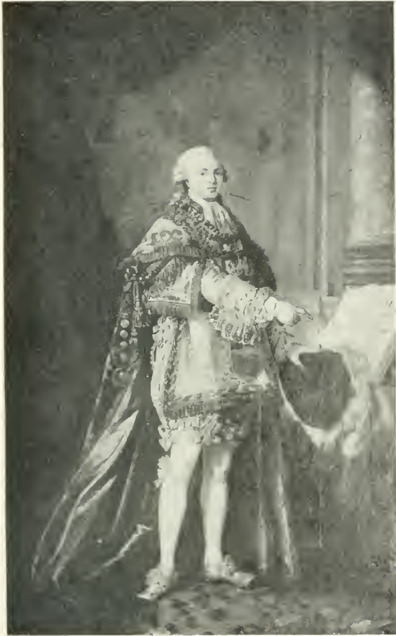
COMTE DE PROVENCE DANS LE GRAND COSTUME DE L'ORDRE DE SAINT-LAZARE, DONT IL ÉTAIT GRAND-MAITRE